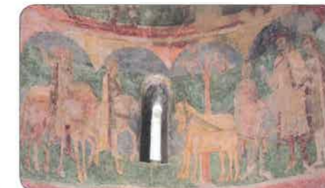
nástená malba v rotundě ve Znojmě