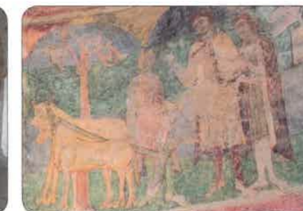
Detail malby v rotundě ve Znojmě zachycuje Přemysla Oráče.

Typickými románskými stavbami byly v té době malé kostelíky kruhového tvaru zvané rotundy .