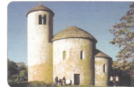
rotunda sv. Jiří na Řípu

Zjistěte, kdo byl podle pověsti Přemysl Oráč.