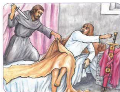
vražda Václava III.

Václav III. byl posledním mužským potomkem královské větve rodu Přemyslovců . Pokud rod už nemá žádného syna, říká se, že vymřel po meči . Roku 1306 tedy Přemyslovci vymřeli po meči . V Českém království vládli přes 400 let. Opět tak začaly boje o český trůn .