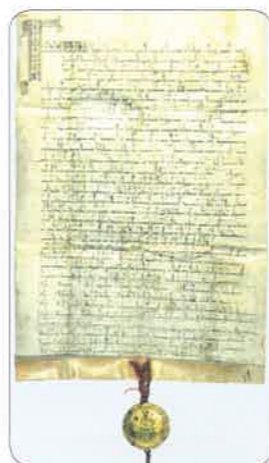
Zlatá bula sicilská

Z Přemyslova dcera, princezna Anežka, vstoupila do kláštera. Roku 1232 založila v Praze na Starém Městě špitál – útulek pro nemocné, přestárlé a chudé. V roce 1989 byla církvi prohlášena za svatou.