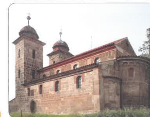
bazilika v Tismicích (nedaleko Prahy)

Pomocí fotografií na této straně porovnejte společné a rozdílné znaky rotundy a baziliky.