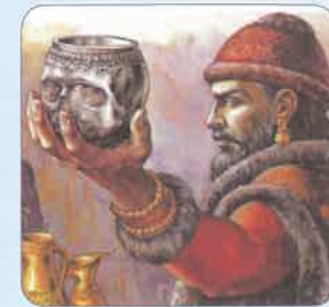
(Eduard Štorch: Hrdina Nik)