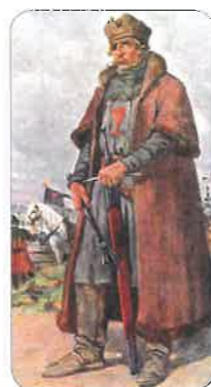
Jan Žižka (1 bod)

5. Kdo skutečně velel husitskému vojsku?